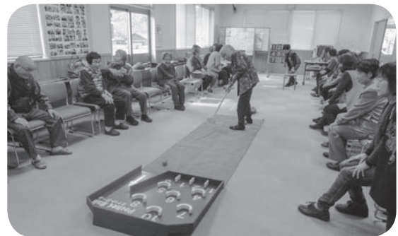
串地区福祉部会(ふれあい会)