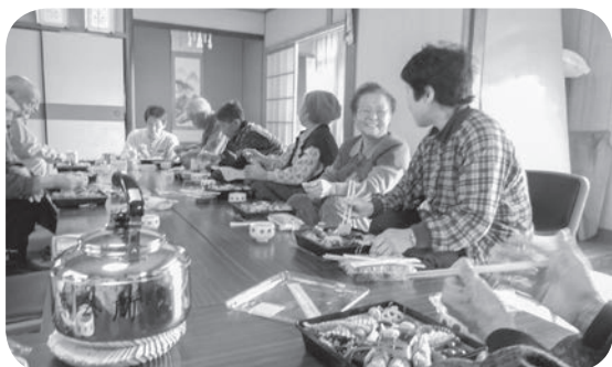
ふれあい・いきいきサロン上角