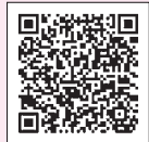
山口市社協HP (事業紹介ページ)