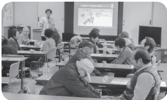
鯖河内地区福祉部会(ふれあい会)