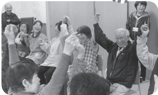
串地区ふれあい会食会